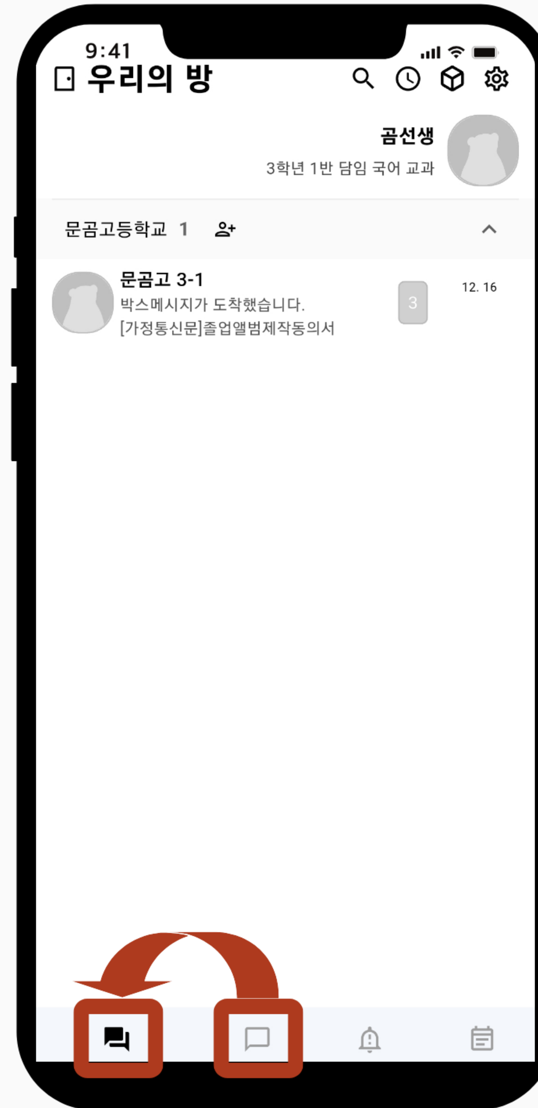
'나만의 방'에 속해 있던 채팅방이 '우리의 방'으로 넘어갑니다