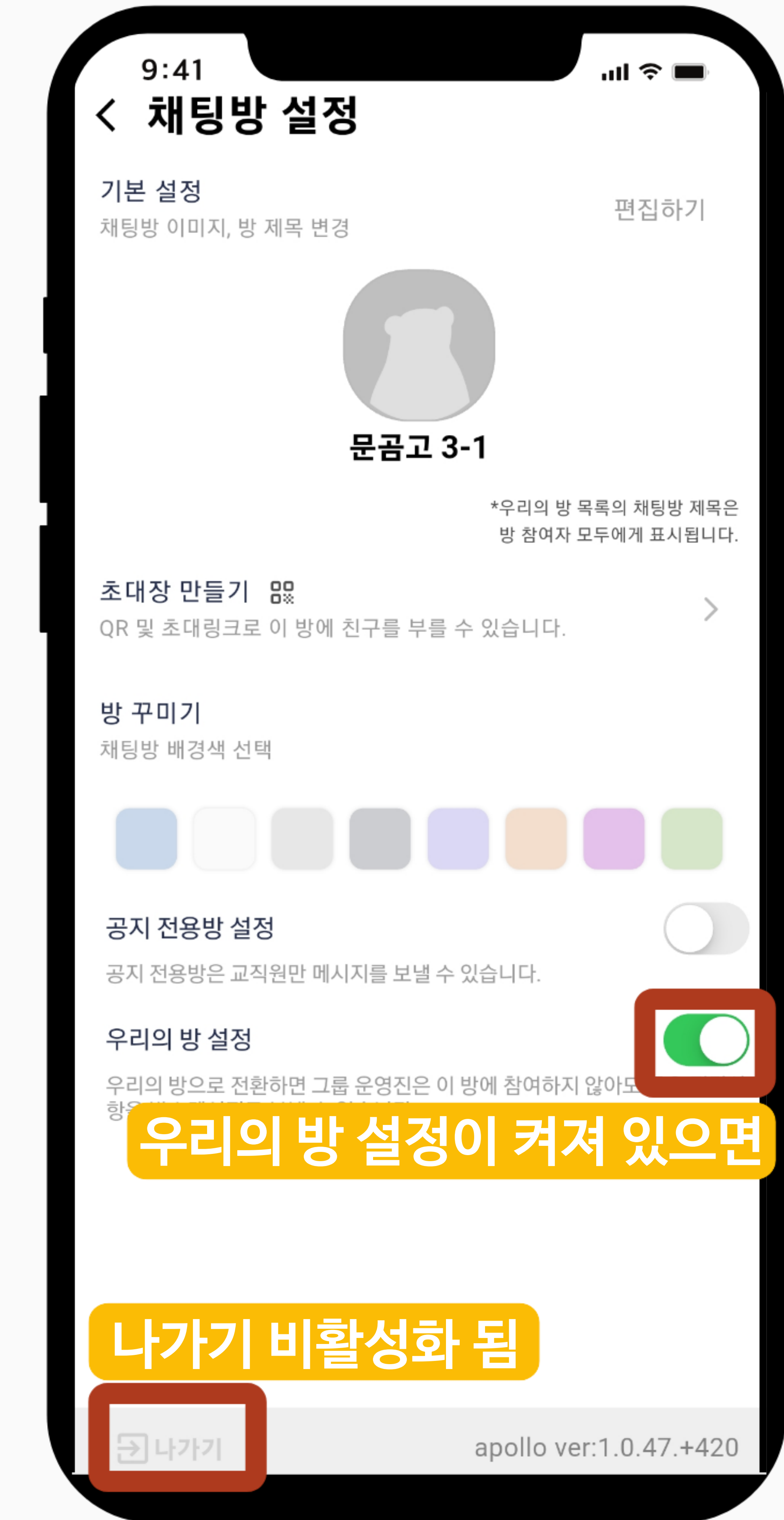
채팅방을 나가는 것이 불가능해집니다 (공적 용도의 방으로 활용하기 위함)